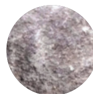
SUAVE ANTHRAZIT- MELIERT