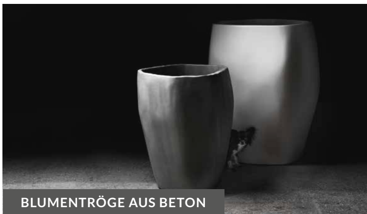
BLUMENTRÖGE AUS BETON